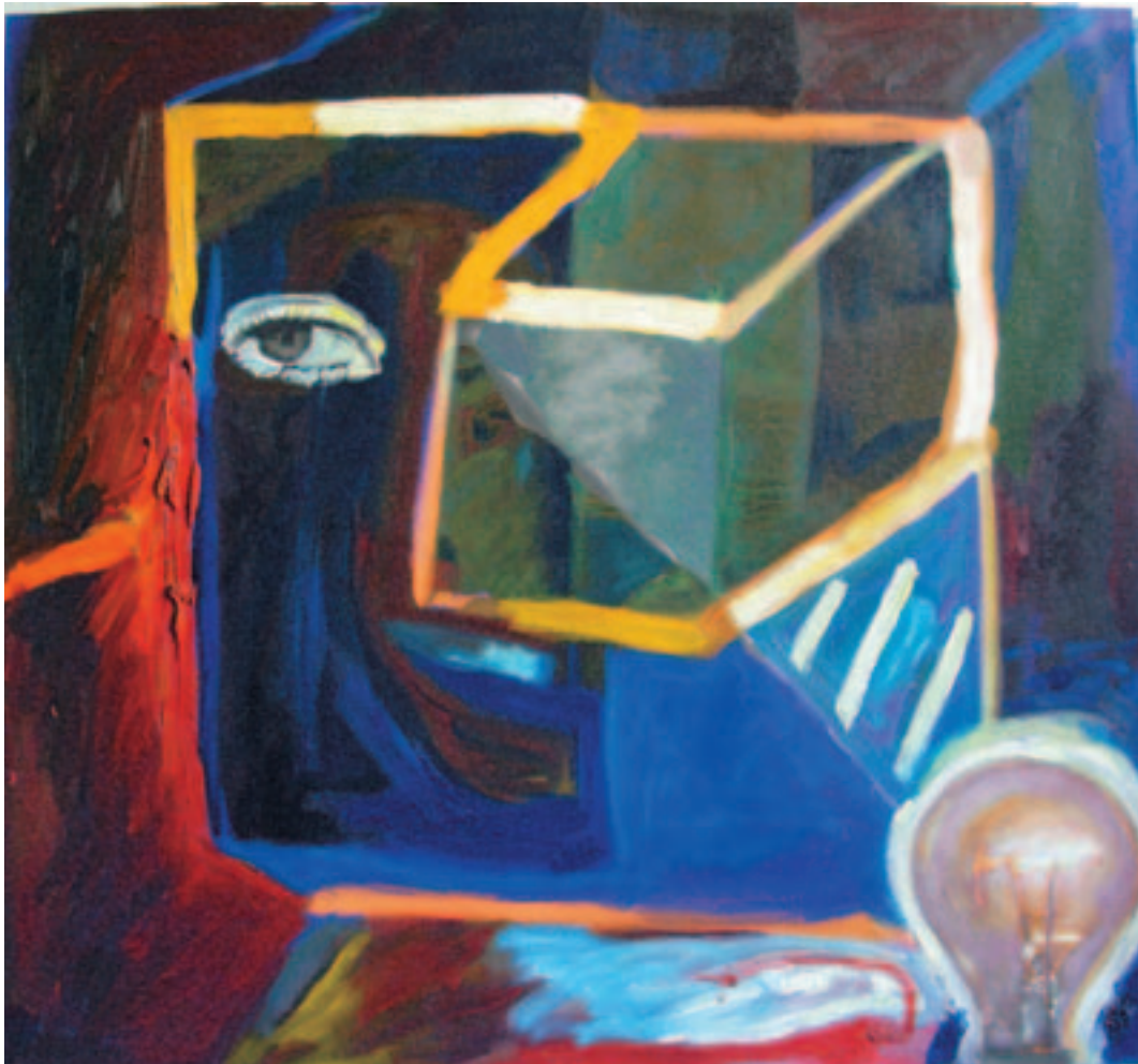
Fernando Eguidazu "Cuatro ensayos en la búsqueda del vasco poliédrico". Óleo/lienzo. 120 x 120 cm.