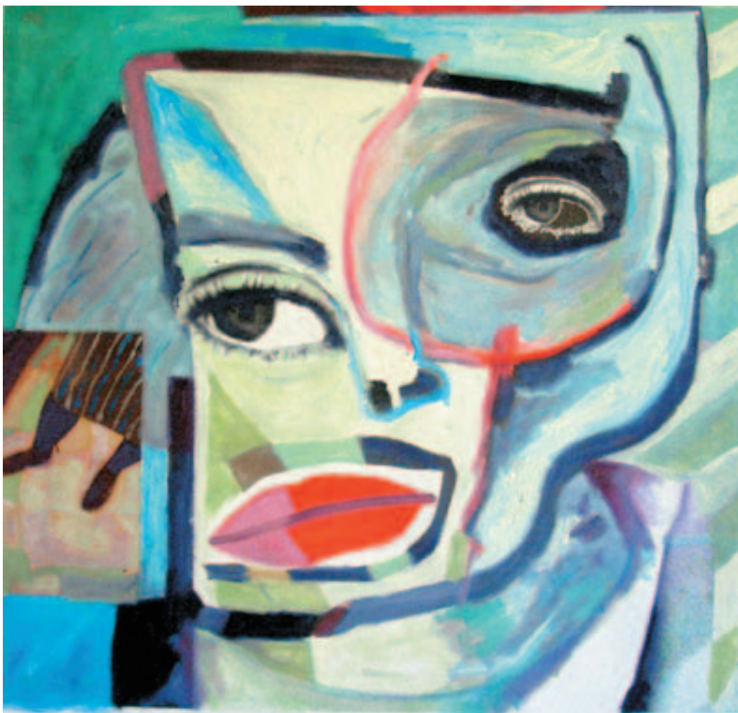
Fernando Eguidazu "Cuatro ensayos en la búsqueda del vasco poliédrico". Óleo/lienzo. 120 x 120 cm.