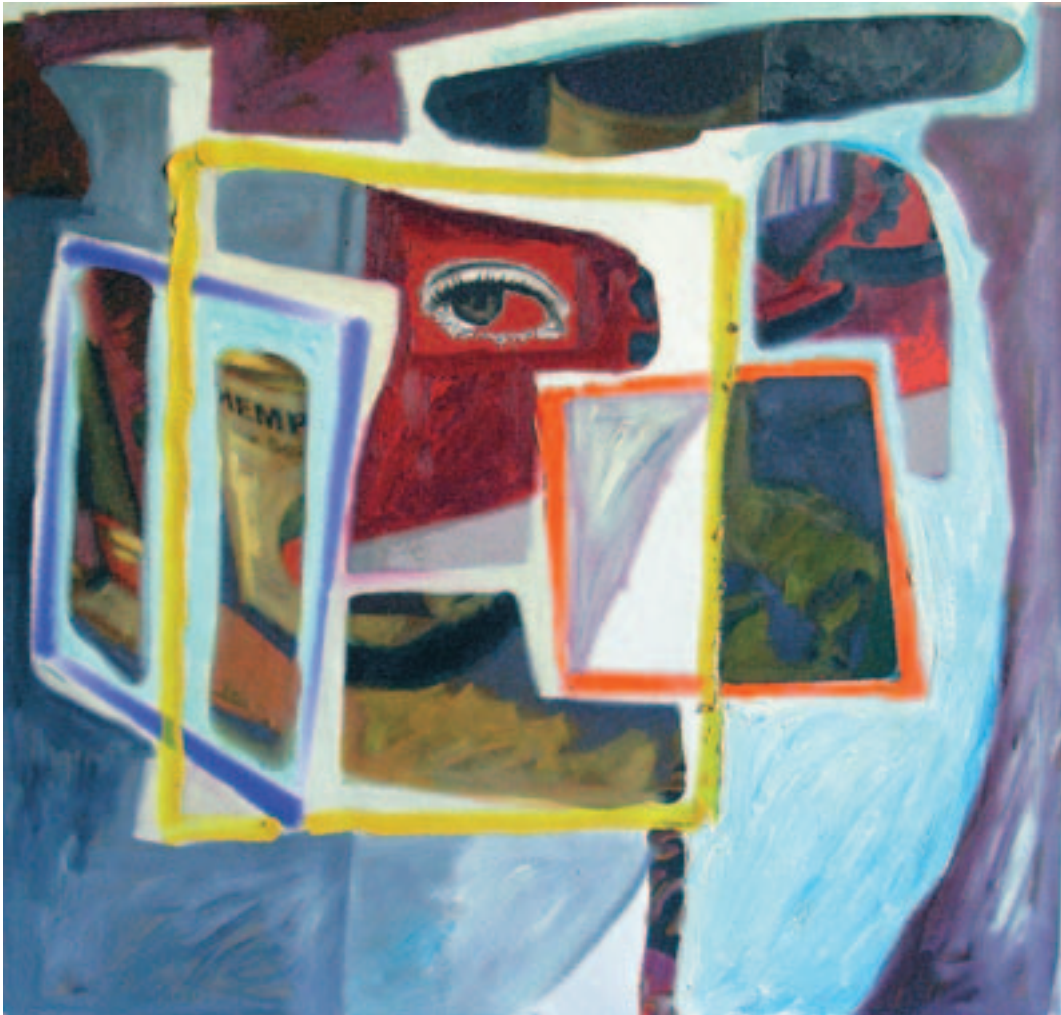
Fernando Eguidazu "Cuatro ensayos en la búsqueda del vasco poliédrico". Óleo/lienzo. 120 x 120 cm.