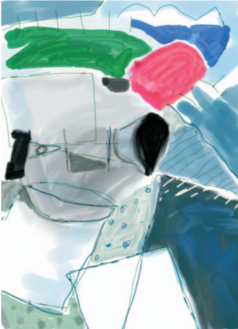
Fernando Eguidazu "La brecha que cicatriza. El vertedero". Técnica mixta/papel. 50 x 70 cm.