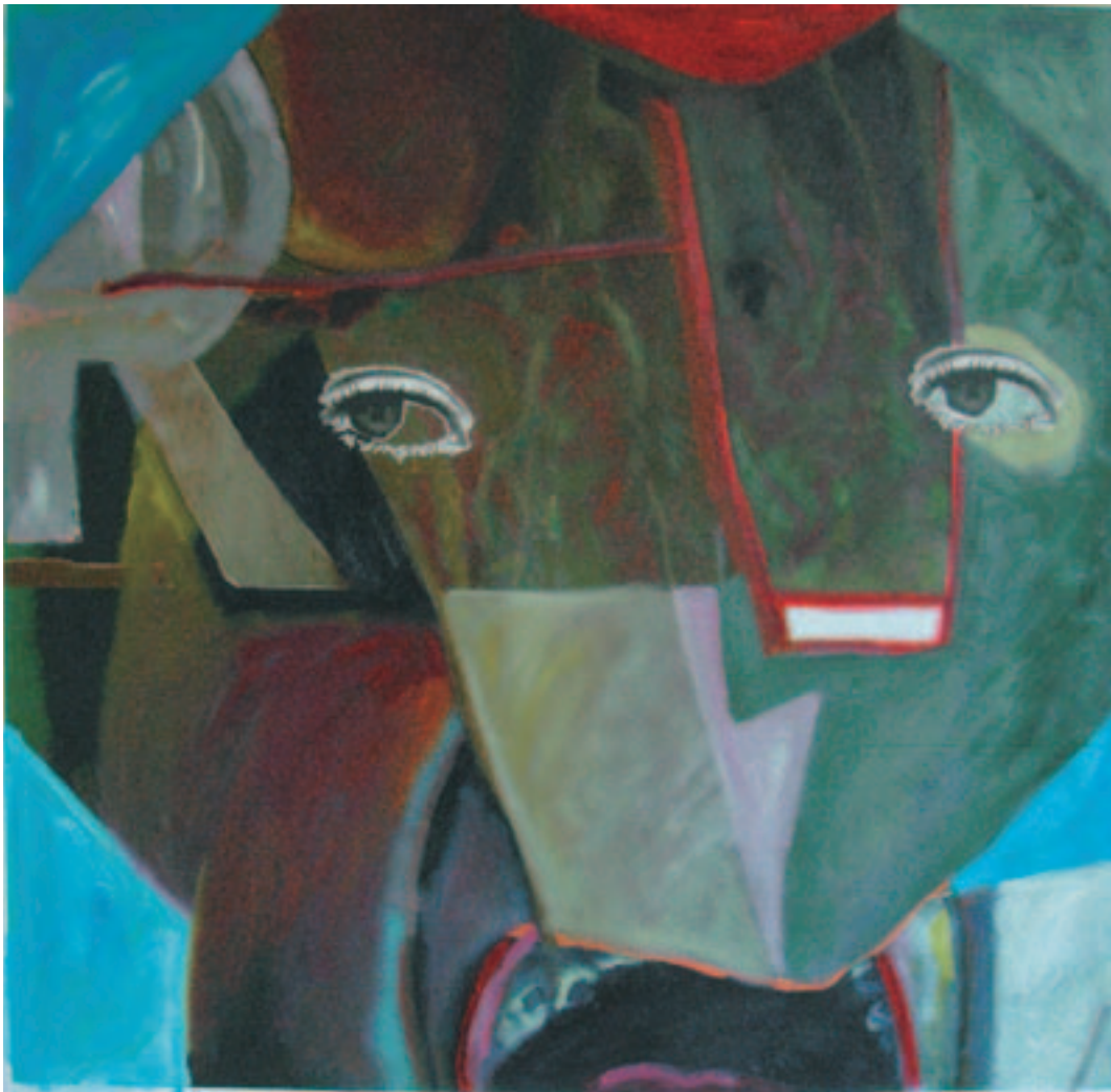
Fernando Eguidazu "Cuatro ensayos en la búsqueda del vasco poliédrico". Óleo/lienzo. 120 x 120 cm.