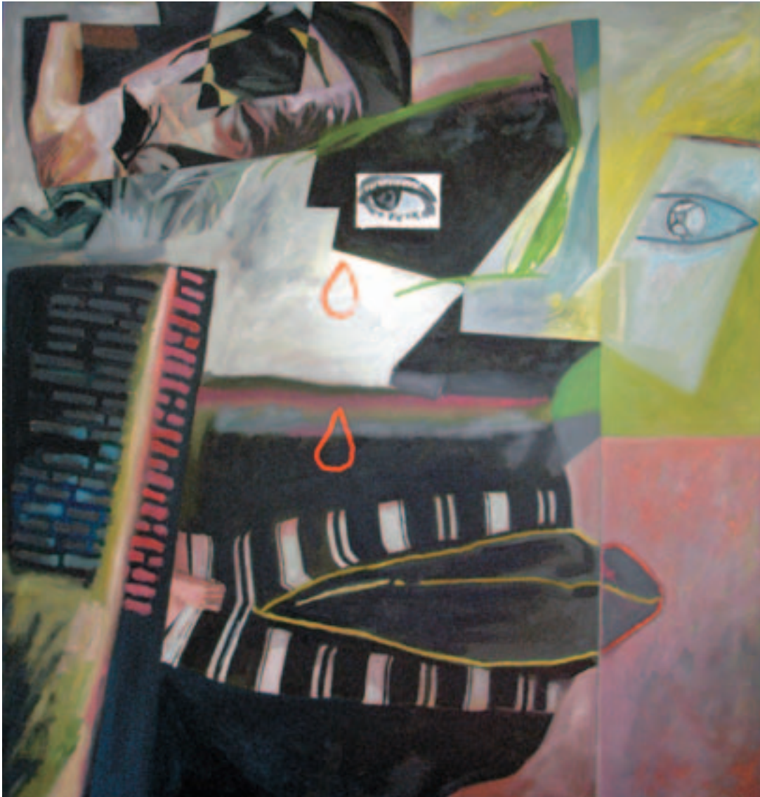
Fernando Eguidazu "El amargo llanto de la mujer-patera". Óleo/lienzo. 130 x 137 cm.